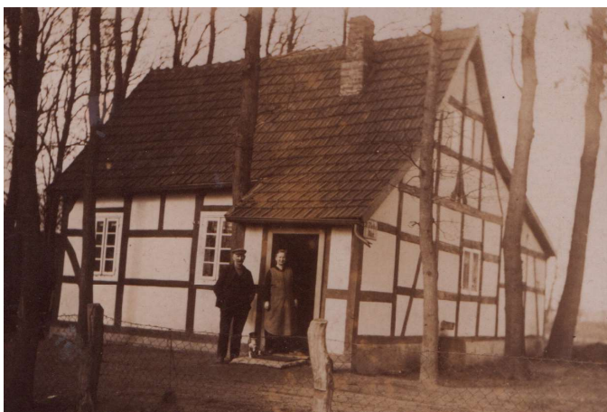
„Wohnen ganz unter Eichen“